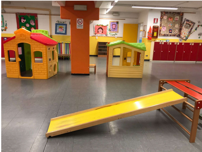
Grande salone attrezzato