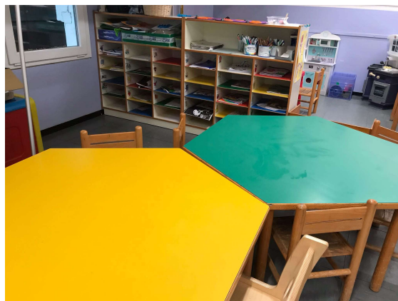
Spazio del disegno libero e della manipolazione