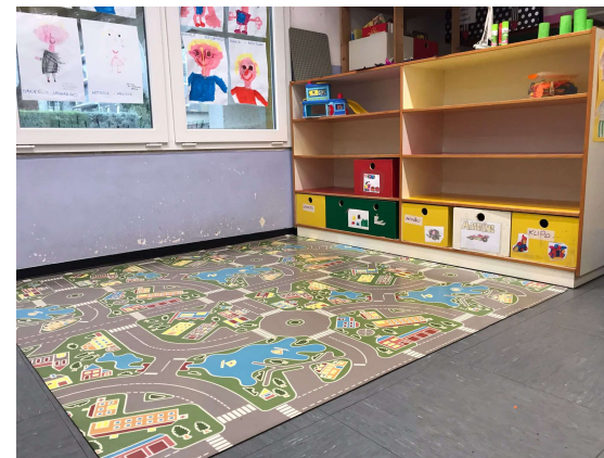
Angolo delle costruzioni