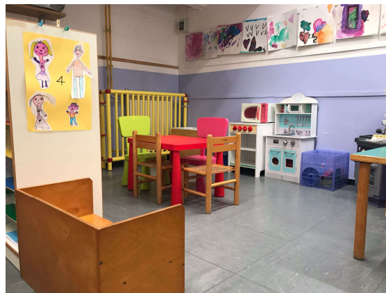
Angolo del gioco simbolico