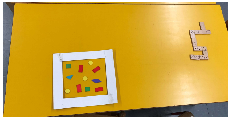
Giochi al tavolo